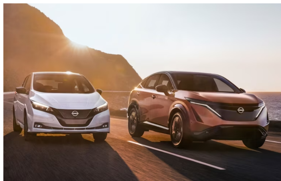
Le Nissan Leaf et le Nissan ARIYA.

À l'heure actuelle, la clientèle s'ayant procuré un nouveau ARIYA se dit très satisfaite du produit et le recommande chaudement à leur famille et amis. Concernant la gamme de modèles à venir, les différentes innovations en matière de design, de technologie, d'économie