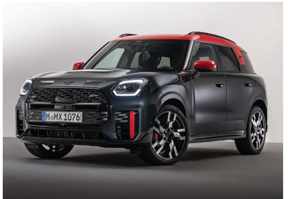
Pour de nombreux clients, l'arrivée de cette toute nouvelle MINI Countryman représentera l'occasion de faire le grand saut de l'essence vers l'électrique.

Quels conseils donner à quelqu'un qui hésiterait à acquérir cette MINI Countryman 100% électrique ? « Je dirais qu'il faut venir la voir et l'essayer, pour se rendre compte du plaisir que l'on peut avoir