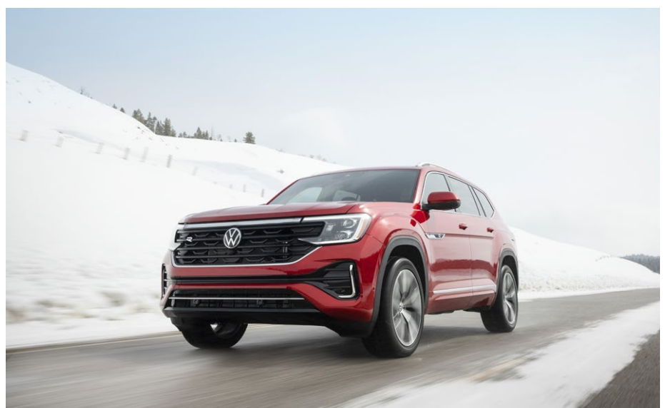
Bas de vignette : La concession de Yan Deroy prévoit une augmentation de près de 40% de son offre de véhicules neufs pour l'année prochaine, comparativement à 2023.

Les conseils prodigués à sa clientèle demeurent également primordiaux. « Maintenant que l'on a plus de véhicules, il faut revenir à la base. Quand le client entre, qu'il y ait une ou plusieurs autos à vendre, il faut être à l'écoute. Il y a de plus en plus d'offres à gauche et à droite, donc nous nous devons d'avoir des procédures