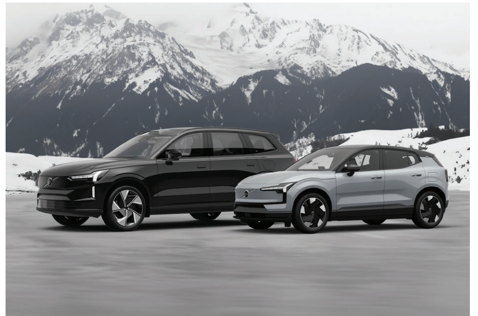
ALBI Volvo Sainte-Agathe prend le soin de rester compétitif en offrant des taux d'intérêt intéressants pour les véhicules neufs et certifiés notamment. Modèles présentés EX30 et EX90, 100% électrique.

Un service à la clientèle qui se veut soigné et professionnel, dès la première entrée dans la concession. « L'ensemble de l'équipe d'ALBI Volvo comprend l'importance de s'informer sur les nouveautés relatives aux véhicules écologiques qu'ils offrent.