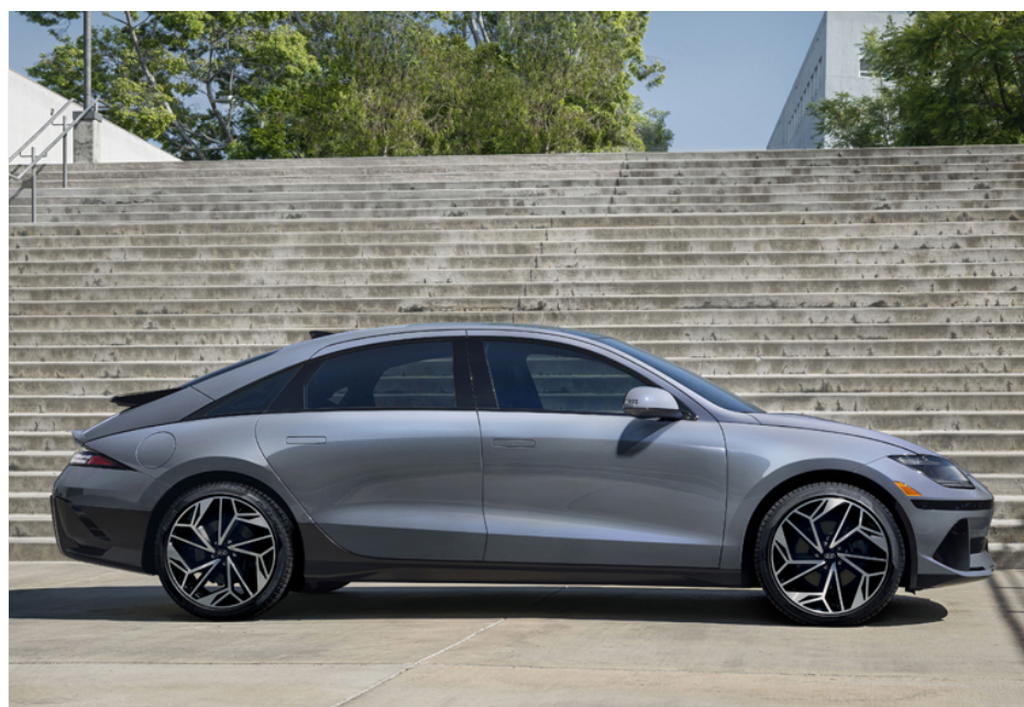
À l'image d'un KONA électrique que le client peut désormais se procurer en moins d'un an au lieu de deux ans auparavant, les délais de livraison sont à la baisse chez Hyundai Val-David.

Le directeur des ventes de la concession Hyundai Val-David voit l'avenir d'un bon œil. « Ça va bon train chez Hyundai. On voit la lumière au bout du tunnel par rapport à l'usine qui arrive. Dès 2024, un nouveau IONIQ 7 va venir compléter un autre type de gamme pour que l'on puisse proposer différents choix à la clientèle. Ça augure bien dans le futur avec des modèles 100% électriques et des délais qui vont tomber plus court », certifie-t-il.