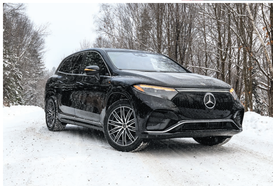
Mercedes-Benz suit de très près ce phénomène d'électrification des véhicules qui s'observe au sein des pays industrialisés.

Outre le virage électrique, les constructeurs européens sont également des innovateurs en matière de batteries. « Il y a de nouvelles technologies de batteries au lithium et au silicium. Ce sont des batteries très performantes, que l'on commencera à