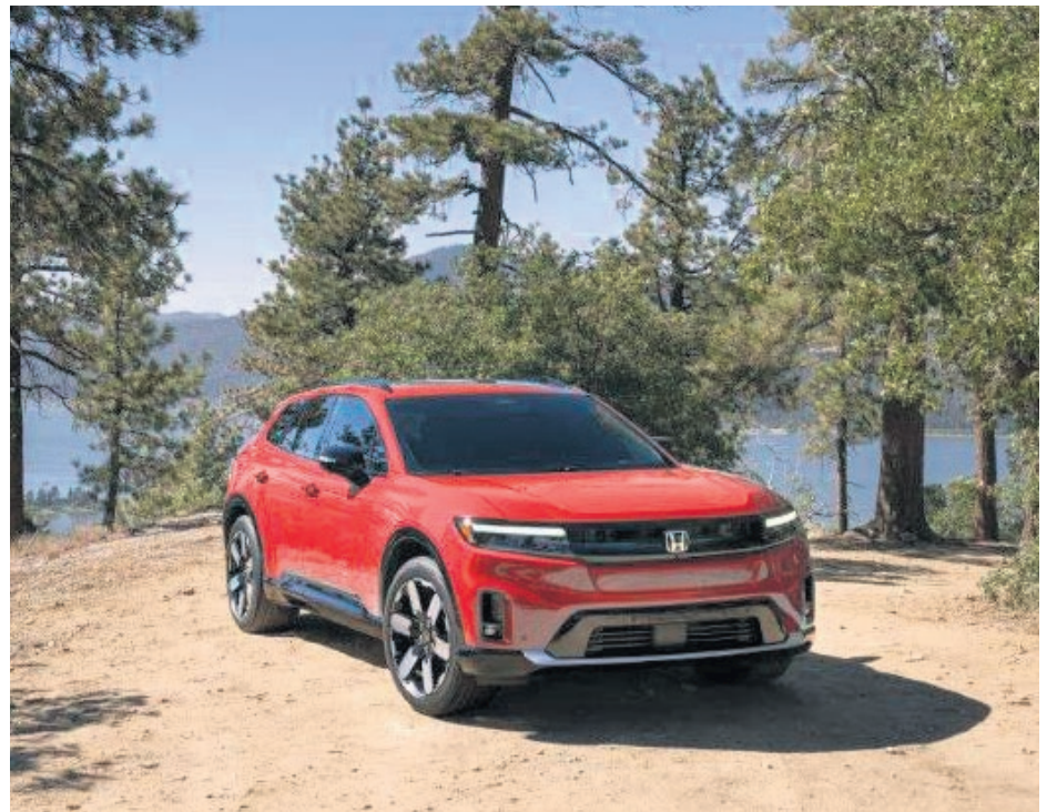
Chez Honda, manufacturier réputé pour être discret en ce qui concerne le design de ses véhicules, il y a fort à parier que les versions actuelles des véhicules redessinés en 2022 et 2023 demeurent les mêmes pour encore quelques années.