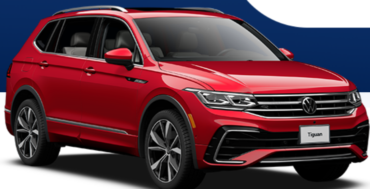
Tiguan Highline R-line